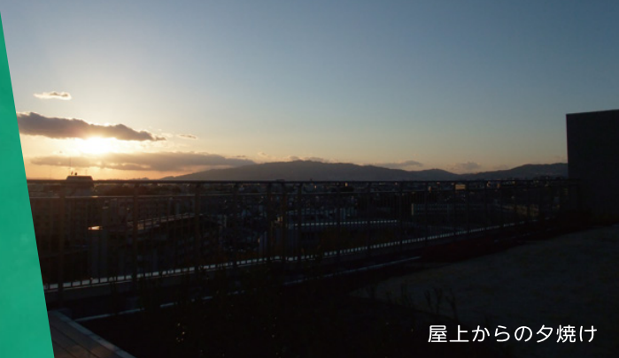
屋上からの夕焼け

その人らしく、ここで、暮らせる我が家となれるよう その人らしく、ここで、生きる喜びを分かち合えるよう その人らしく、ここで、支えることを喜びとなれるよう ここから、人と人の輪をひろげ、つなげていきます。